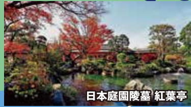
日本庭園陵墓 紅葉亭