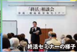
終活セミナーの様子